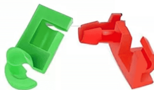
Tailgate handle rod clips set