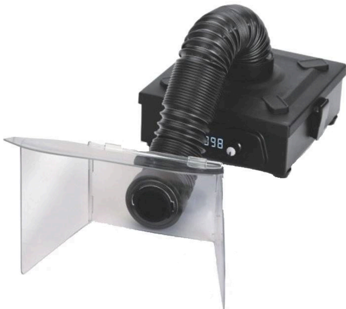
Przykładowe zastosowanie z opcjonalną osłoną (brak w zestawie, należy dokupić osobno)