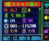
System parameter setting interface Scroll bar indication