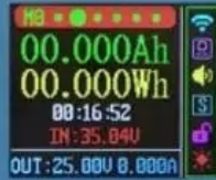
Capacity record interface