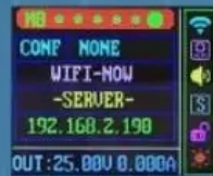
Scroll bar indication