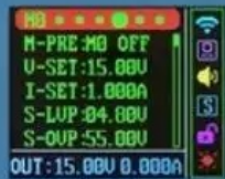
Power parameter setting interface Scroll bar indication