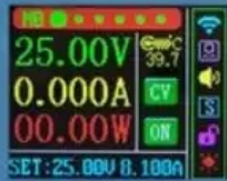
Power main interface