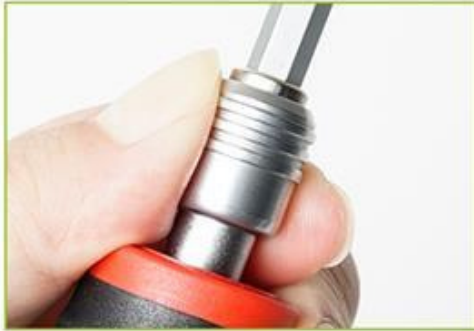
6.3mm Quick Release Chuck