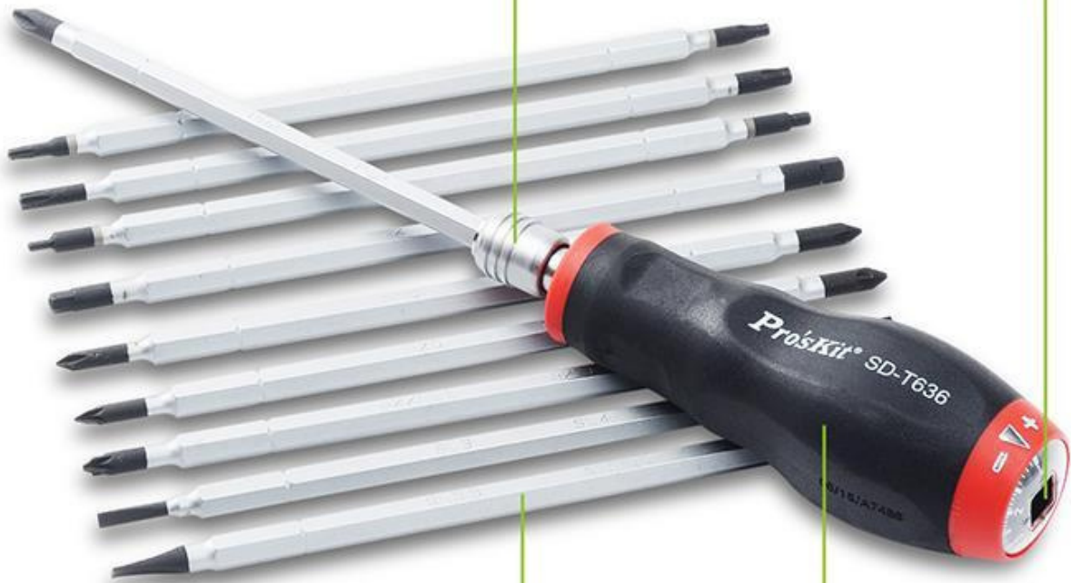
AISI 8660 CrMoV Steel