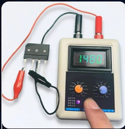
Rectifier Bridge Test