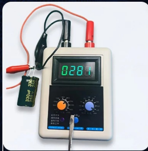
Electrolytic Capacitor Test