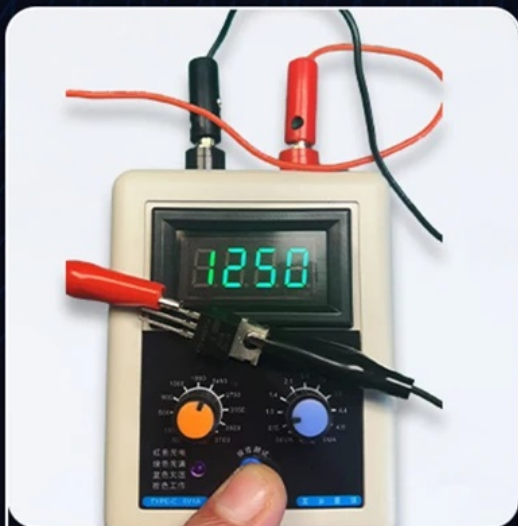
Unidirectional Thyristor Test