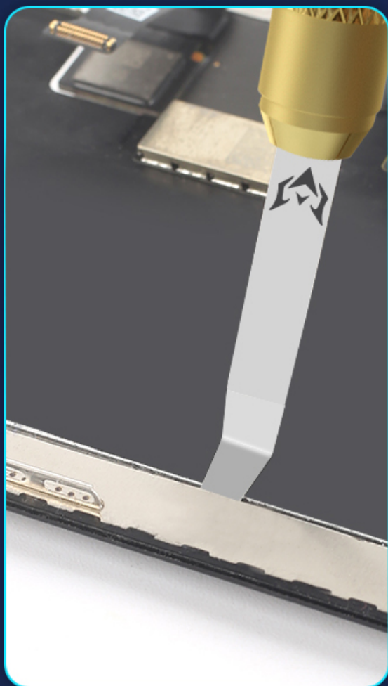
Long cutter head 6.5mm/thickness 0.12mm For removing the screen wide-edge bracket

different phone mounts Dismantling with different pry knives