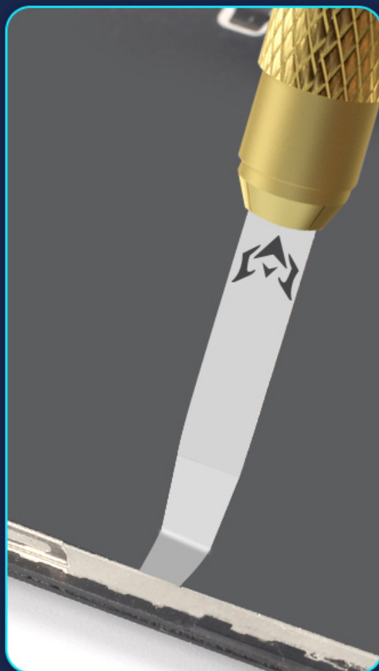
Short cutter head 4.6mm/thickness 0.12mm Used to remove the narrow screen bracket