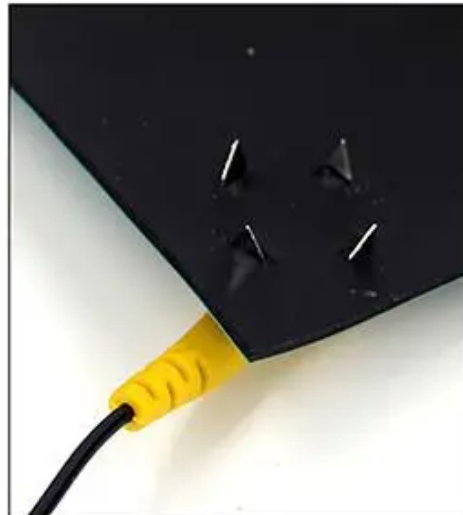
2. Wbić zaczepty do maty ESD