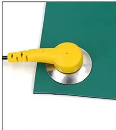
4. Połączenie gotowe