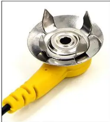
1. Odgiąć zaczepty pod kątem 90°