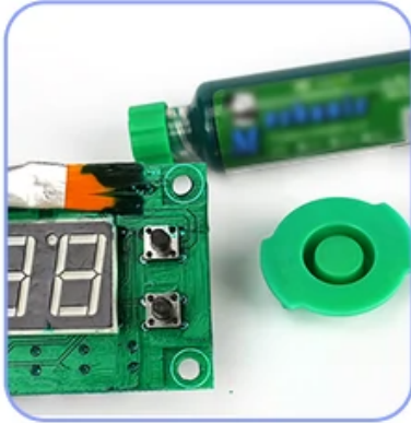
green oil curing