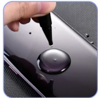
OCA optical glue curing