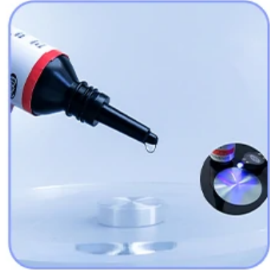
shadowless glue curing