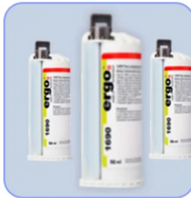
resin glue curing